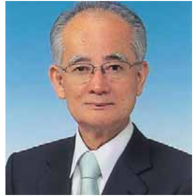
副地区ガバナー（京都LC）