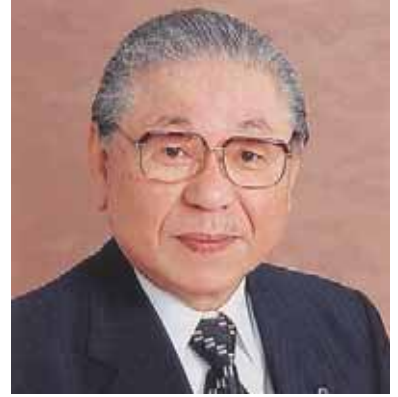
ライオンズクラブ国際協会 335-C地区ガバナー