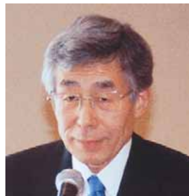
ホストクラブ会長（京都西LC）