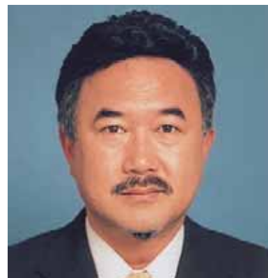
キャビネット会計（京都西LC）