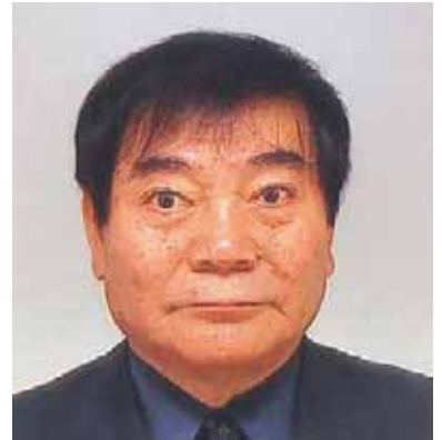
キャビネット幹事（京都西LC）